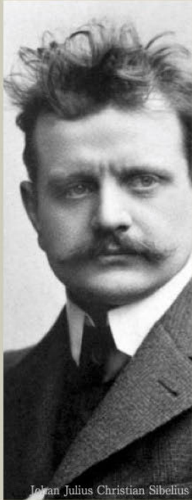
Johan Julius Christian Sibelius