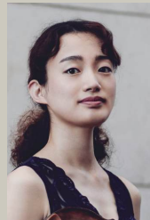
毛利文香 (Fumika MOHRI) Violin

ソウル国際音楽コンクール第1位、バガニーニ国際ヴァイオリンコンクール第2位、エリザベート王妃国際音楽コンクール第6位、モントリオール国際音楽コンクール第3位。横浜文化賞文化・芸術奨励賞、ホテルオークラ音楽賞等受賞。