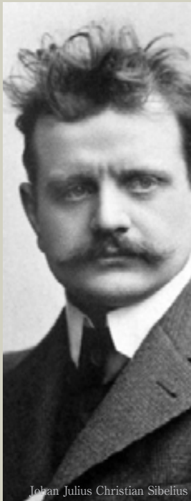
Johan Julius Christian Sibelius

クラシック音楽は、国や時代、精神性によってさまざまな表情を見せる。 しかし、“北欧の音楽”に出会う機会は、決して多くはない。